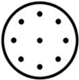
150mm Grip 9H